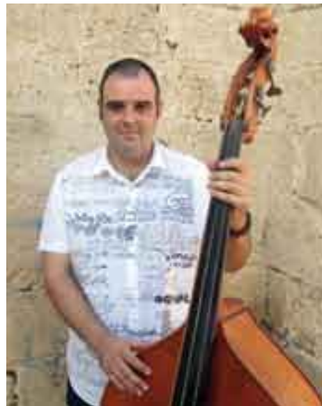
■ En Marc amb el seu contrabaix.

Com que és la darrera pregunta vull enviar una salutació al món sardanista, balladors, músics i altres i als lectors de la revista SOM. Gràcies.