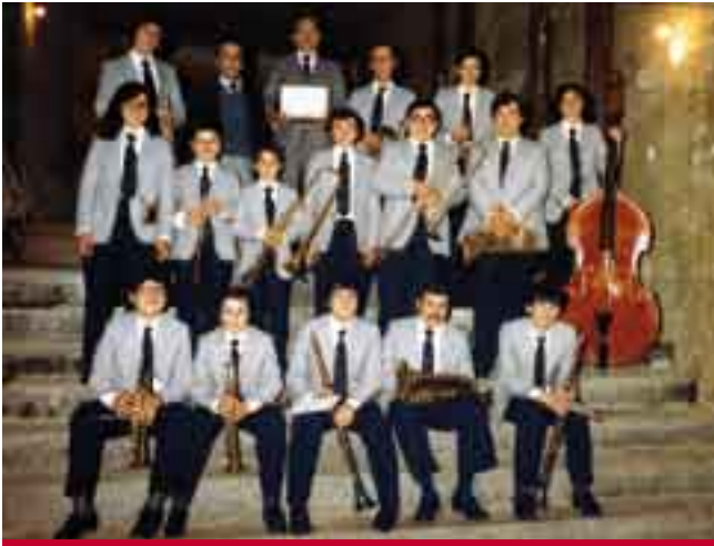
■ La Juvenil Marinada en el dia de la X edició de la Nit de la Sardana, debut oficial de la cobla el 9 de maig de 1981 al teatre La Salut de Badalona.

que s'estava fent es decideix fer un petit concert a les sales del Col·legi dels Maristes com a premi als joves músics i com a reconeixement als professors de l'escola de cobla, directius i pares dels joves. L'èxit del concert anima els responsables del Grup Sardanista Marinada, que decideix organitzar una ballada amb la Juvenil Marinada unes setmanes després, mentre es prepara l'esperat debut oficial. Aquest debut es produeix el 9 de maig de 1981 en el decurs de la mitja part de la X edició de La Nit de la Sardana que aquell any se celebrava a Badalona on varen interpretar dues sardanes. Els components de la cobla Juvenil Marinada que varen actuar aquell dia i per tant són els fundadors de la cobla són: