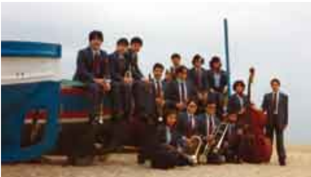
■ Fotografia de la cobla Juvenil Marinada a la platja de Badalona.