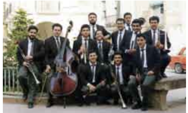
■ La cobla Marinada a l'aplec de Benissanet (Tarragona) l'any 1991.