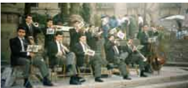
■ La cobla Marinada el mes de febrer de l'any 1990 al Poble Espanyol de Barcelona, en un cicle de ballades organitzades per les colles de Barcelona.