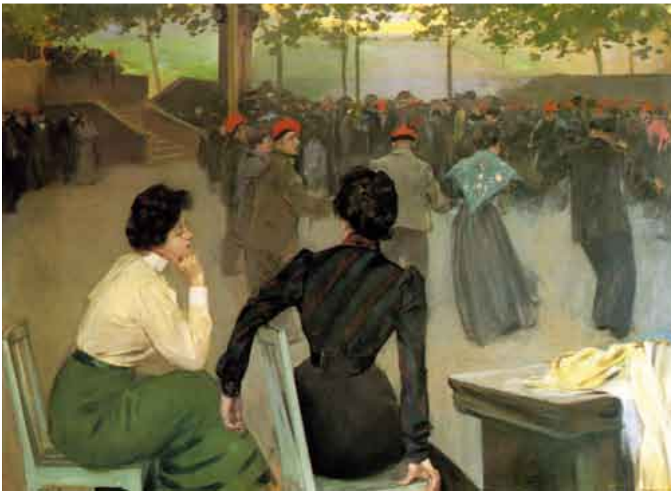
■ Sardanes a la font de sant Roc, d'Olot , pintada el 1902.

És, creiem, una de les pintures més boniques i remarcables que s'han fet de la nostra dansa. ■