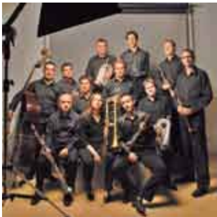
Foto cobla Sant Jordi

Així, l'esdeveniment principal serà el concert-ballada del divendres 29 de juny, al Broadgate Circle. És una activitat inclosa dintre del City of London Festival 2012, el que suposa garantir-ne la seva difusió per la importància que se li vol donar. La cobla responsable de la part musical serà la Sant Jordi-Ciutat de Barcelona.