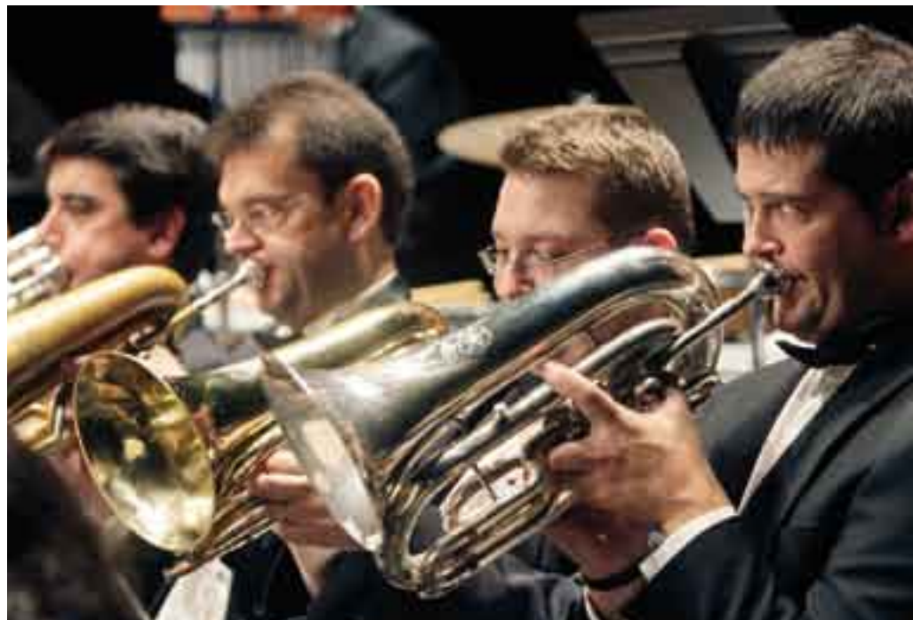
■ Fotografies d'en Lluís Franco

Una altra tasca a fer és la internacionalització de la cobla. No ens quedem per a nosaltres la meravellosa música que ens ofereix la cobla. Serà necessari tenir uns bons ambaixadors de la música, si més no a Europa, sobradament coneixem moltes músiques de fora que han arribat aquí sense que les haguem demanat, possiblement hagin tingut uns bons comercials. Si creiem en la cobla, per què no en fem una bona promoció pels qui vénen de fora? Per què no l'exportem com fan altres països? ■