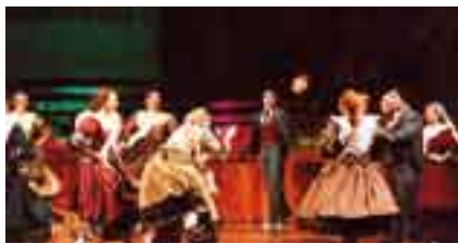
Esbart Joaquim Ruyra