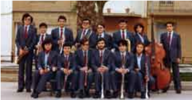
■ La cobla Juvenil Marinada a la rambla de Badalona, un diumenge de 1984.